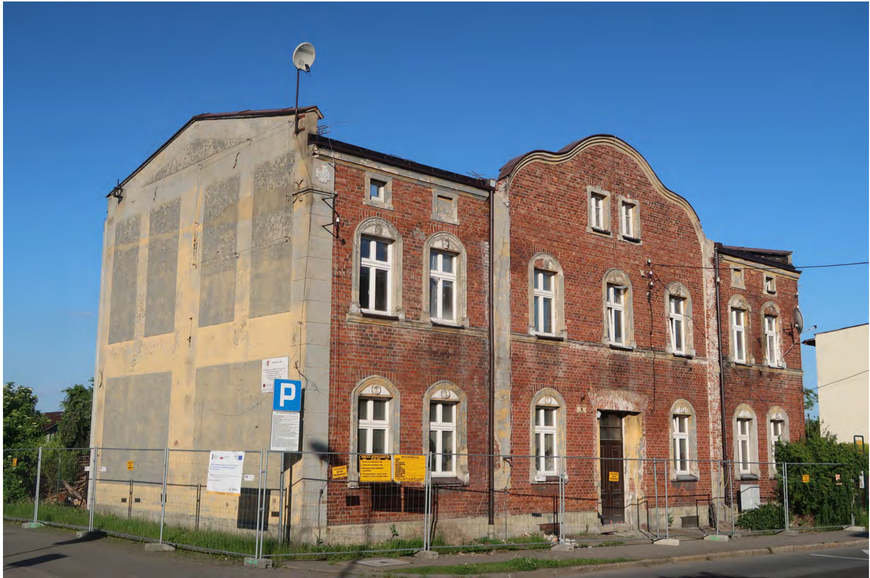
Stan obecny elewacji