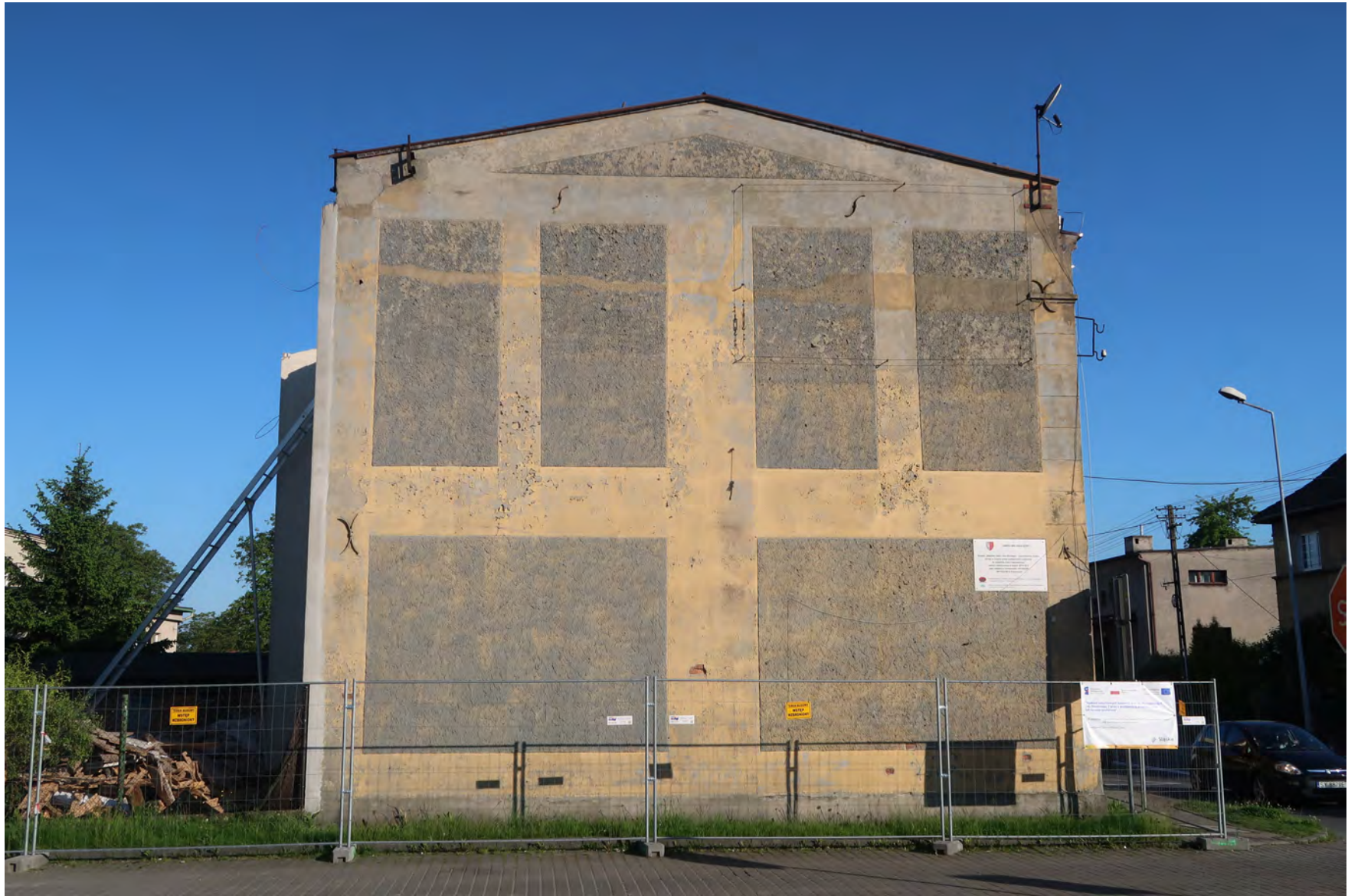
Stan obecny elewacji