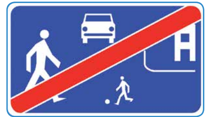
D-41 KONIEC STREFY ZAMIESZKANIA