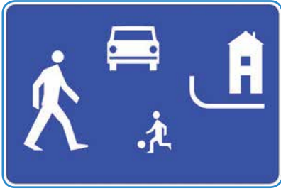
D-40 STREFA ZAMIESZKANIA

> Do Urzędu Miasta Żory coraz częściej docierają uwagi i skargi mieszkańców na kierowców, którzy notorycznie przekraczają dozwolone prędkości. Przez to mieszkańcy nie czują się bezpiecznie, a w szczególny sposób wyrażają troskę o małe dzieci idące np. do szkoły.